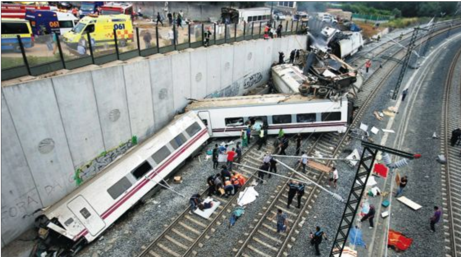
El tren accidentado anoche, en la curva de A Grandeira, a la entrada de Santiago de Compostela.

La tragedia se registró al inicio del puente del Día de Galicia y en la noche donde Santiago vive su fiesta grande, unos actos que el Ayuntamiento suspendió de inmediato. PÁGINA 10