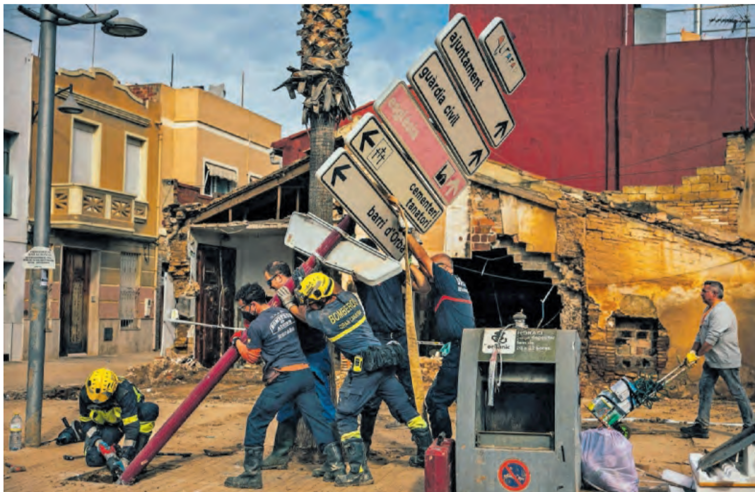
Unos bomberos sujetaban ayer un poste dañado por la dana en la localidad valenciana de Alfafar.

El mundo irónico de Álvaro Pombo gana el Premio Cervantes —P44