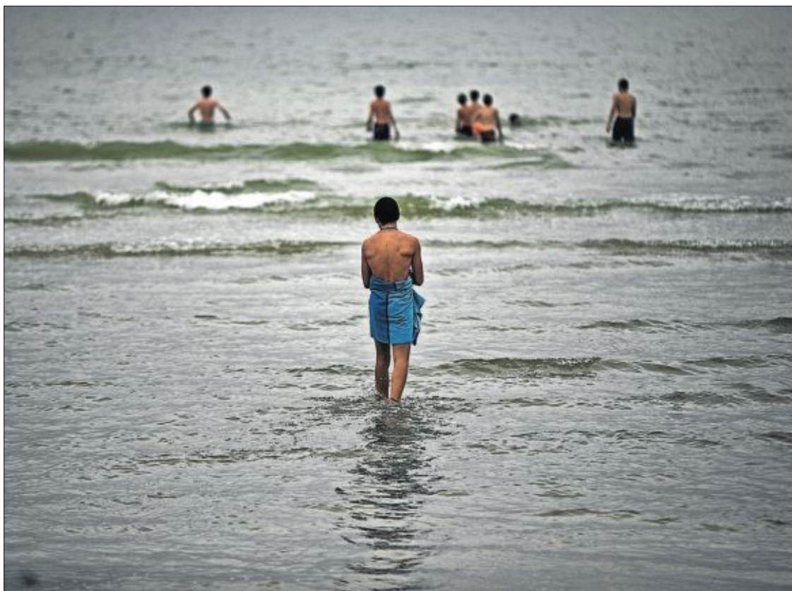
La playa de Ostende, en un día lluvioso de mediados de julio.