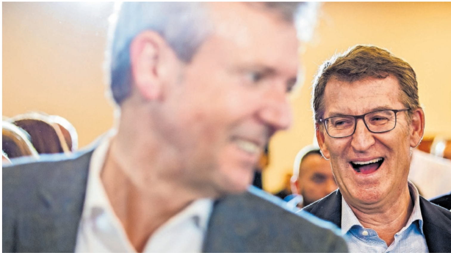
Alfonso Rueda y, tras él, Alberto Núñez Feijóo, ayer en Santiago durante la celebración de la victoria electoral del PP.

Drogas La policía investiga si un chico de 14 años murió por la 'cocaína rosa' —P34