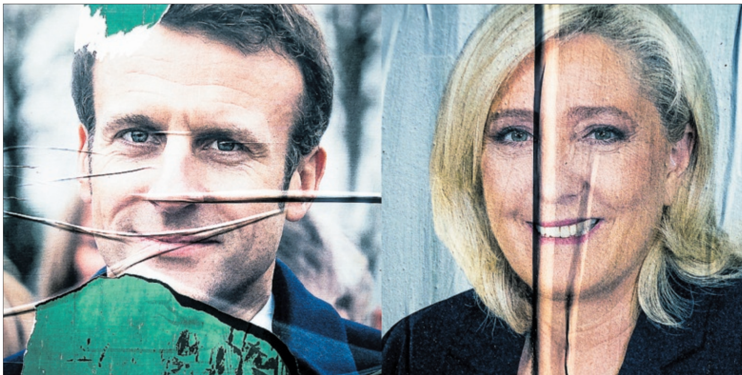
Carteles electorales de Emmanuel Macron y Marine Le Pen, en París.

Corinna Larsen mandó investigar a 14 amigos de Juan Carlos I P14 y 15