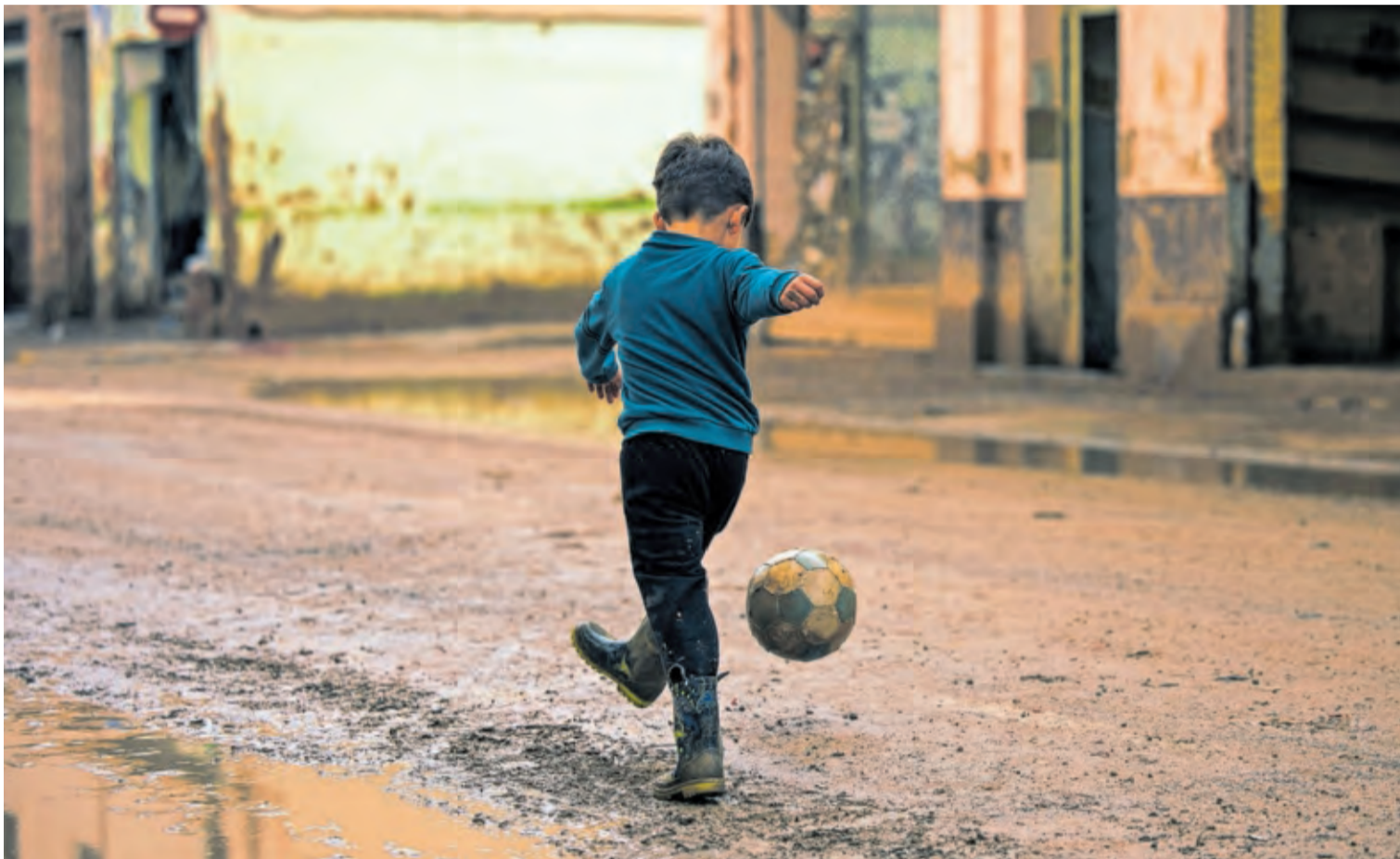
Un niño jugaba ayer con un balón en una calle de Paiporta, tras las nuevas lluvias. ÓSCAR CORRAL

Un emotivo homenaje a la radio en su centenario —P51