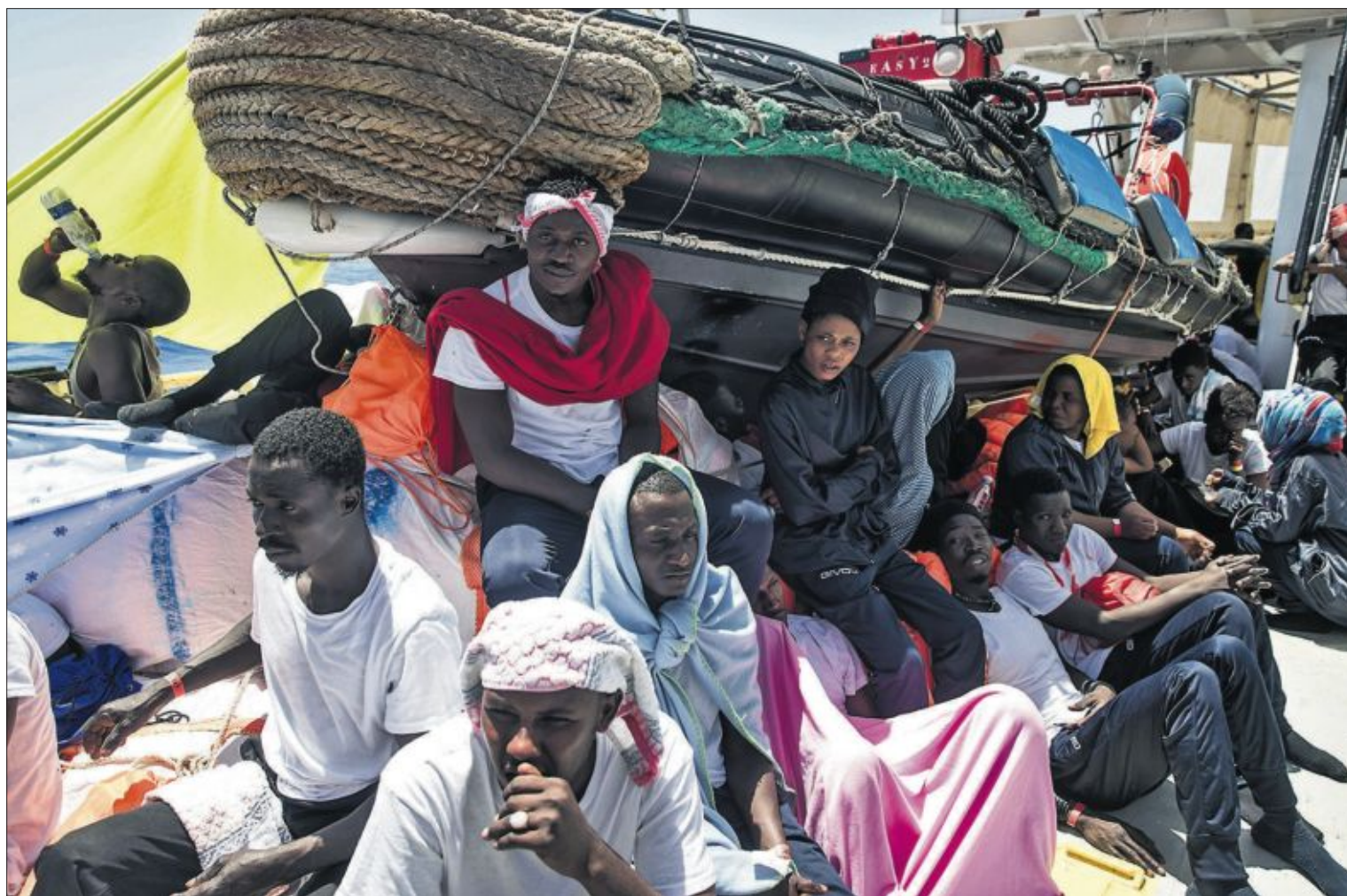
Un grupo de subsaharianos, ayer en la cubierta del Aquarius tras ser rescatados por su tripulación.

nald Trump, insultara públicamente al primer ministro de Canadá, al que llamó "débil" y "deshonesto". Francia y Alemania han mostrado su hartazgo ante la política incendiaria de Trump, que acusó al mundo entero de robar a EE UU y decidió en el último momento apearse del comunicado conjunto de la cita tras las críticas canadienses a su giro proteccionista. PÁGINA 4