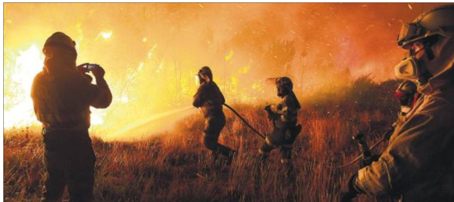
LA OLEADA DE INCENDIOS ARRASA UN PARAJE NATURAL EN GALICIA. La oleada de incendios que azota Galicia desde mediados de agosto ha arrasado el paraje natural de Monte Pindo (A Coruña), que alberga algunas especies vegetales únicas en España. En una sola noche, el fuego calcinó unas 3.000 hectáreas en varias zonas, como en el municipio coruñés de Negreira (en la imagen). PÁGINA 19

El Vaticano ha abierto la puerta a revisar el celibato de los curas para responder a la "apertura de los tiempos". En su primera entrevista, concedida al diario El Universal de Venezuela, su nuevo número dos, Pietro Parolin, recordó que "no es un dogma" y que en temas como este "se puede pensar en modificaciones". PÁGINA 32